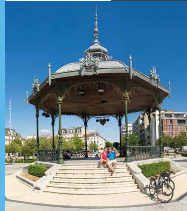
Les Cars de la Région Auvergne-Rhône-Alpes