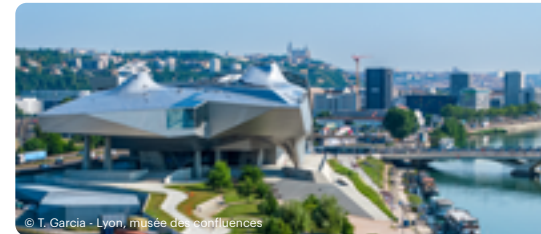
Photo couverture : © T.Pudonnet/Auvergne-Rhône-Alpes Tourisme - Lyon - Saint-Georges/Andréjordan/le Sabine

1 Arrêt situé Galerie D, Gare routière Rhône, Quai R8. | Ces horaires sont donnés à titre indicatif, les autocars étant soumis aux aléas de la route.