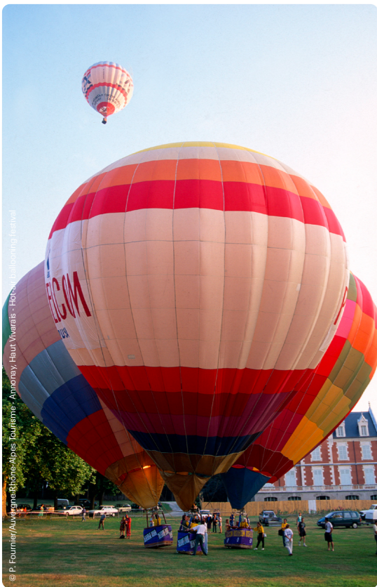
© P. Fournier/Auvergne-Rhône-Alpes, Tourisme - Annonay, Haut Vivarais - Hot Air Ballooning Festival